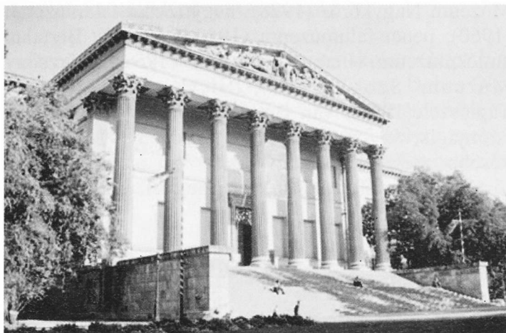
Magyar Nemzeti Múzeum

A timpanon szobordíszei Raffael Monti milánói szobrász alkotása: középen Pannónia nőalakja trónol, kezében egy-egy babérkoszorúval, melyet jobbról a tudomány és művészet, balról a történelem és a hírnév megszemélyesítőjének nyújt át.