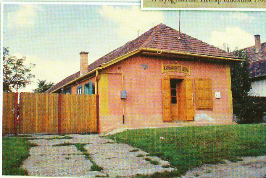
Az Angyal gyógyszerésztár épülete napjainkban

sa, valamint hogy a kísérleteket a férfi kollégákkal együtt elvégezhesse. Végül is nagy megbecsülést vívott ki magának, és kitüntetéssel végezte el az egyetemet 1903-ban.