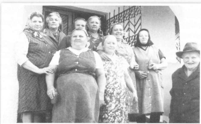
Lelkes isaszegi asszonyok egy csoportja, akik „aranyos kezükkel” széppé varázsolták az új múzeum helyiségeit az átadásra