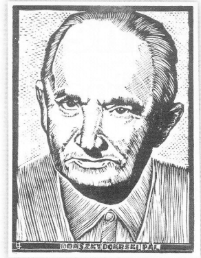
Trojan Marian Jozef grafikusművész linóleummetszete

2013. november 16-án a Falumúzeum és a Múzeumbarátok Köre szervezésében Máté Endre Domszky Pál a varsói magyar című könyvét mutatták be a Falumúzeumban. A decemberi lapszámunkban Domszky Pál (1903–1974), a magyar–lengyel kapcsolatok kutatója és ápolója emlékére megrendezett könyvbemutatóról, valamint az életútjáról szóló összefoglalót olvashatták. Az erről készült írás folytatását az alábbiakban közöljük le.