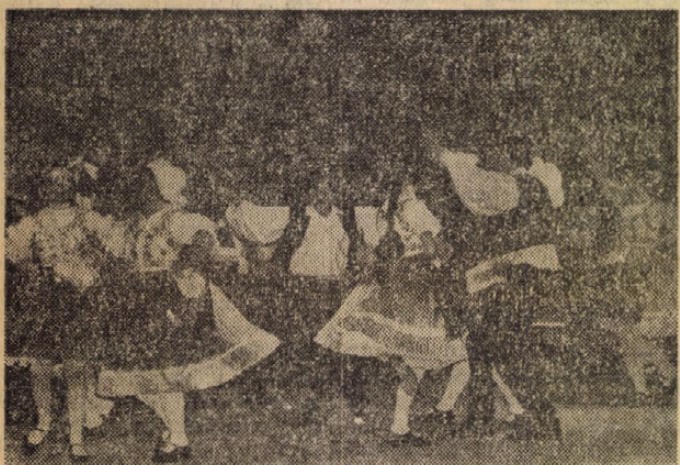
Az Isaszegi Csata táncegyüttes a verbunkost próbálja.