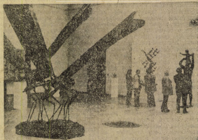
Részlet a kiállításról. Előterben a Szitakötő

Minden érdekl, az emberi, ami kedves, ami valaha fájt, ami jövő lesz; Ady, kiállítás, munka, szitakötő, Afrika, Tinódi Lantos Sebestyén, mártír, emlék, Prometheus, Lenin — hazánk, eszme, nagyvilág. Képes a váltásokra, az árnyalásokra, a mozgalmasságra, mert termékeny és nyílt. Ebből adódik alkotó módszerének mélyes demokratizmusa, közérthető formáival mindenkit győnyörködtet. Elmélyül az Ipari szakoktatás fontos társadalmi teendőivel, szoborral bizonyítja, hogy korunk Prometheusai a tüzet diadalmasan fejük fölé emelő munkások, Időzik a népmesék idilli hangulatain, megkeresi Bolyai Farkas és Bolyai János sudár alakjában a rendíthetetlen magatartást, a begombolkozott Adyban egy