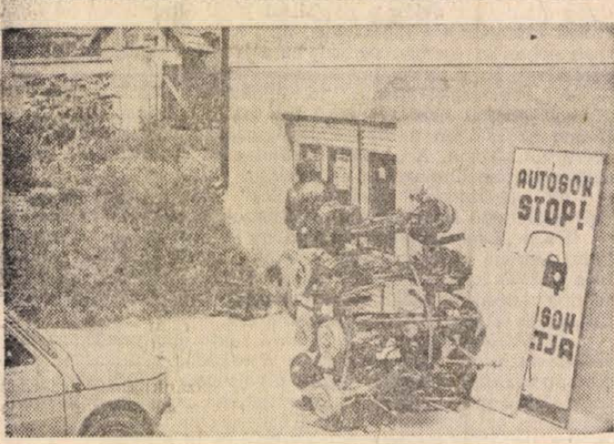
Már nemesak Gödöllőn, az autójavítóban, hanem Aszódon is van használt autókatrészbolt. A Gödöllői Autójavító Kiszválat és a turai Galgavideke Áfész közös üzletét a 30-as fő- közlekedési út Hatvan felé vivő szakaszán rendezték be