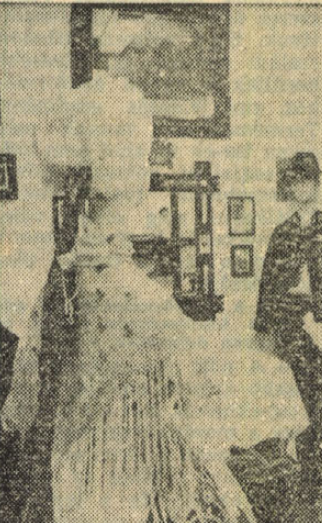
Régi parasztszoba, korabeli népviselet