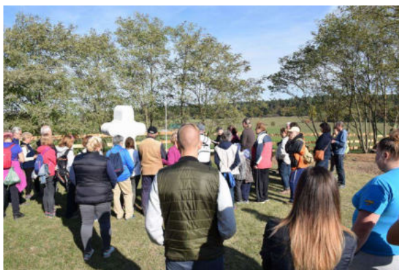
Történelmi ismertetés a Kőkeresztnél