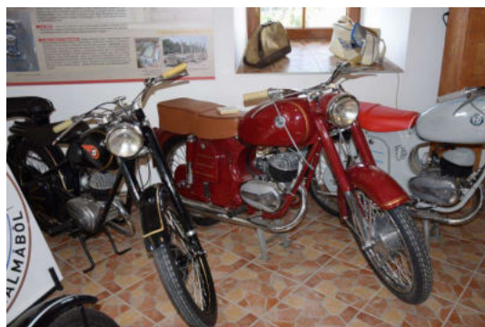
A gyűjtemény egy részlete