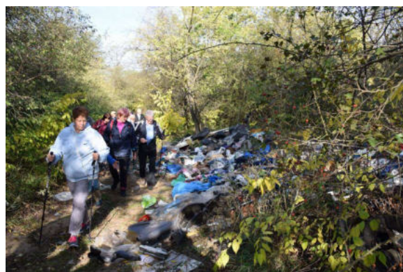
A turistaút mellett, illegális szeméthalmok