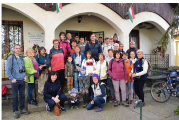
Kis csoportunk indulás előtt, a múzeumnál

A gyönyörű szép időben megtartott túránkat sajnos nagyban beárnyékolta a valkói út, és a Telefon ália földútjai mentén, illegálisan lerakott nagymennyiségű szemét látványa!