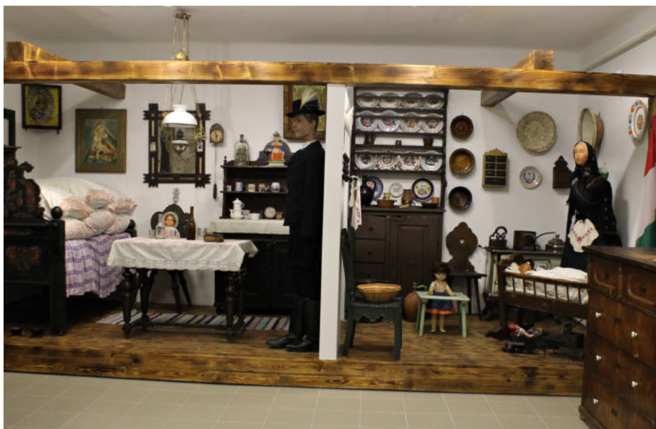
A szépen felújított szoba és konyha enteriőr

„Az Isaszegi Múzeumi Kiállítóhely precízen és teljes körűen eleget tett a 2017-ben a Kubinyi Ágoston Programon nyert pályázatának!”