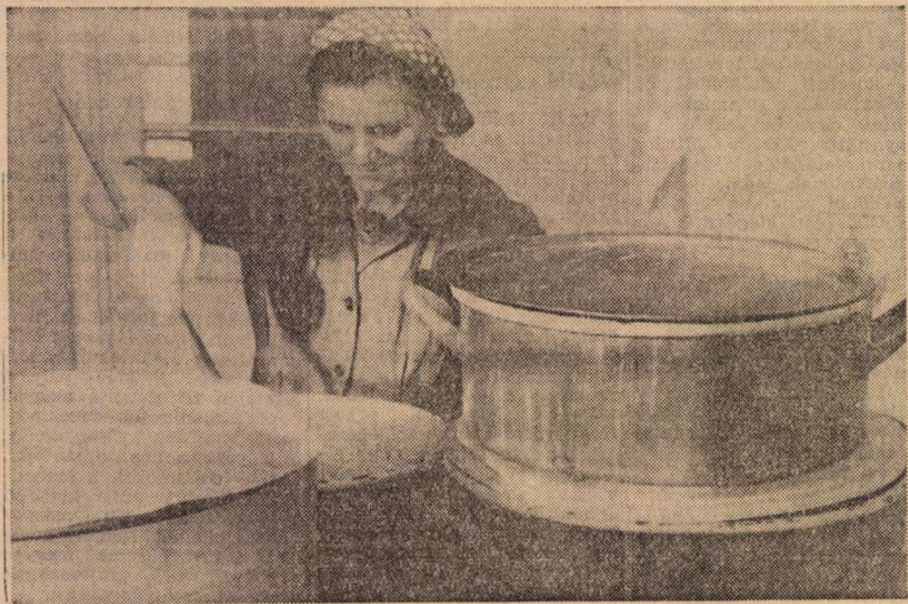
„Teljes gőzzel üzemelnek”

A konyhában délelőtt 10 órakor már készítik a szakácsok az ebédet. 30 literes lábasokban fő az izes ebéd. Felemelgetjük a fedőket: ma darakrémeves, szemes babfőzelék, vagy szalonnás marhasült a menü, aki ezt sem kedveli, annak natúr szelet burgonyával. A harmadik fogás, cseresznyés-, tirolirétes. A jóétvágyról a friss zebegényi levegő gondoskodik.