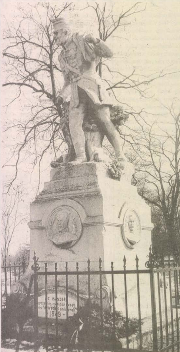
Ezt a honvédszobor emlékművet 1901-ben állították a csata 50. évfordulójára

— Sajnos ez azonban nem volt mindig így — mondja