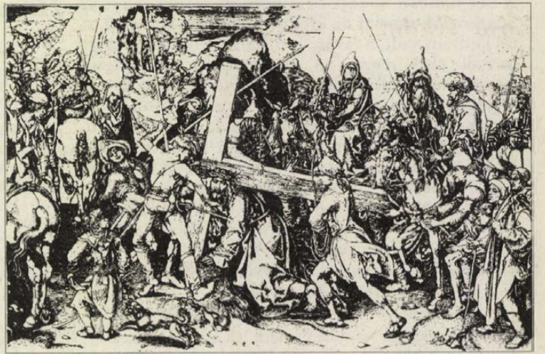
Martin Schongauer: A nagy Keresztvitel (XV. század második fele)