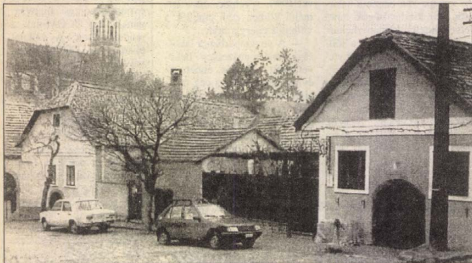
Tervezés előtti állapot

*Lapunk pénteki számában beszámoltunk a kitüntetéseket átnyújtó rendezvényről (A szerk.)