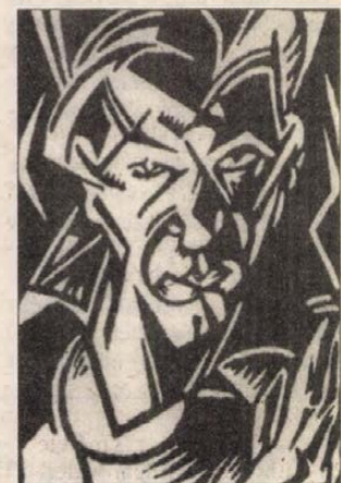
Bortnyik Sándor: Önarckép (1918–19)

álta Blokk poémáját, Madách és Hauptman műveit, az előbbi montázsos, expresszív formálásában a berlini baloldali művészeti irányzatokra jellemző naturalisabb, didaktikus elemek uralkodnak. Az utóbbiakban szűkösnek érezvén a síkban való mozgást, a tér meghódítására törekszik. S bár sík felületen