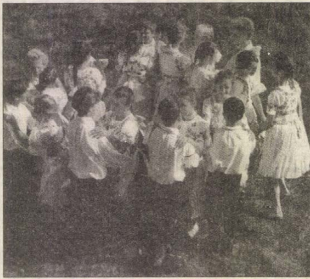
„Csatába” léptek már a kisiskolások is

Hol lépnek fel? Legelőbb Isaszegen. A helyi, a hagyományokat őrző szokások, ünnepek, májfadöntés, szüreti bál legfontosabb szereplője az együttes. De eljutnak messzire is. Júliusban az olaszországi Campogianóban rendezett nemzetközi folklórfesztiválon vettek részt. Augusztus 20-án a budai várbeli ünnepségen. Szeptemberben a tápéi búcsún. Novemberben az isaszegi asszonykórus — mely egy töröl fakadt a táncegyüttesrel — a gyöngyöstarjáni minősítő versenyen a II. helyezést hozta el. Négy órákor elkezdődik az