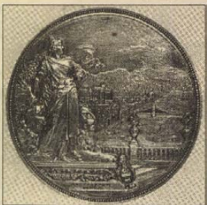
A magyarok Erzsébet királynőjét ábrázoló emlékerem

A Nemzeti Múzeumban bemutatott érmeik egyaránt részei a magyar és az európai történelemnek. Az éremművészet fejlődését a reneszánsztól, Hunyadi Mátyás uralkodásától I. Ferenc József koráig követi nyomon. A kiállítás anyagából megtudhatjuk, hogy Mátyás emlékermei (egy kivételével) itáliai mesterek munkái. Mátyás halála után a magyarországi művészet a német kultúrkör hatása alá került. A XVI. századtól a magyarországi éremművészetben kiemelkedő