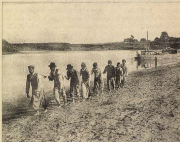
André Kertész: Hajóvontatás a folyón felfelé (Tiszaszalka, 1919)

„Olyan magyarázatot találhat az ember erre a munkára, amelyet csak akar, annyit viszont elmondhatok, hogy elkészítésük izgató és felettébb szórakoztató volt” — nyilatkozta egy alkalom-