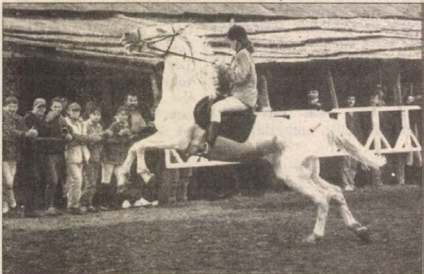
Az Ilka-majorban rendezett lovasbemutató az időjárás a lovasokat és „társaikat” egyaránt kemény próba elé állította

Az eredményhirdetés után játékos lovasvetélkedőn és bemutatón vettek részt a sportbarátok. V. Cs.