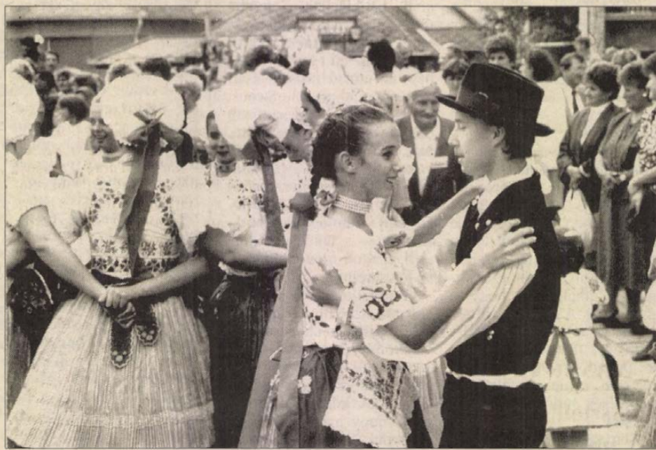
Isaszegi fiatalok szüreti mulatságon