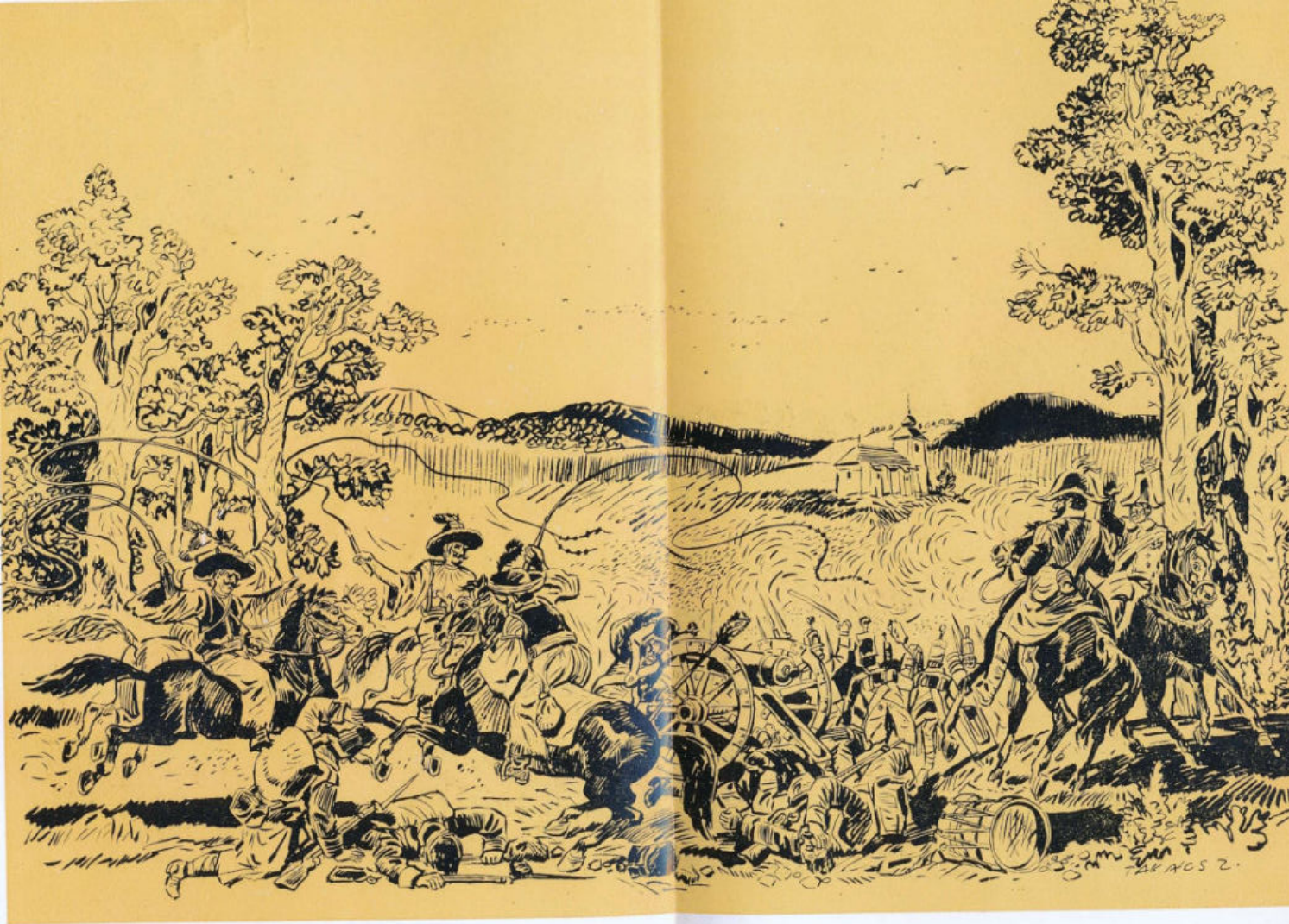
Szabadcsapat-beliek rajtaütése az osztrák tüzérekén