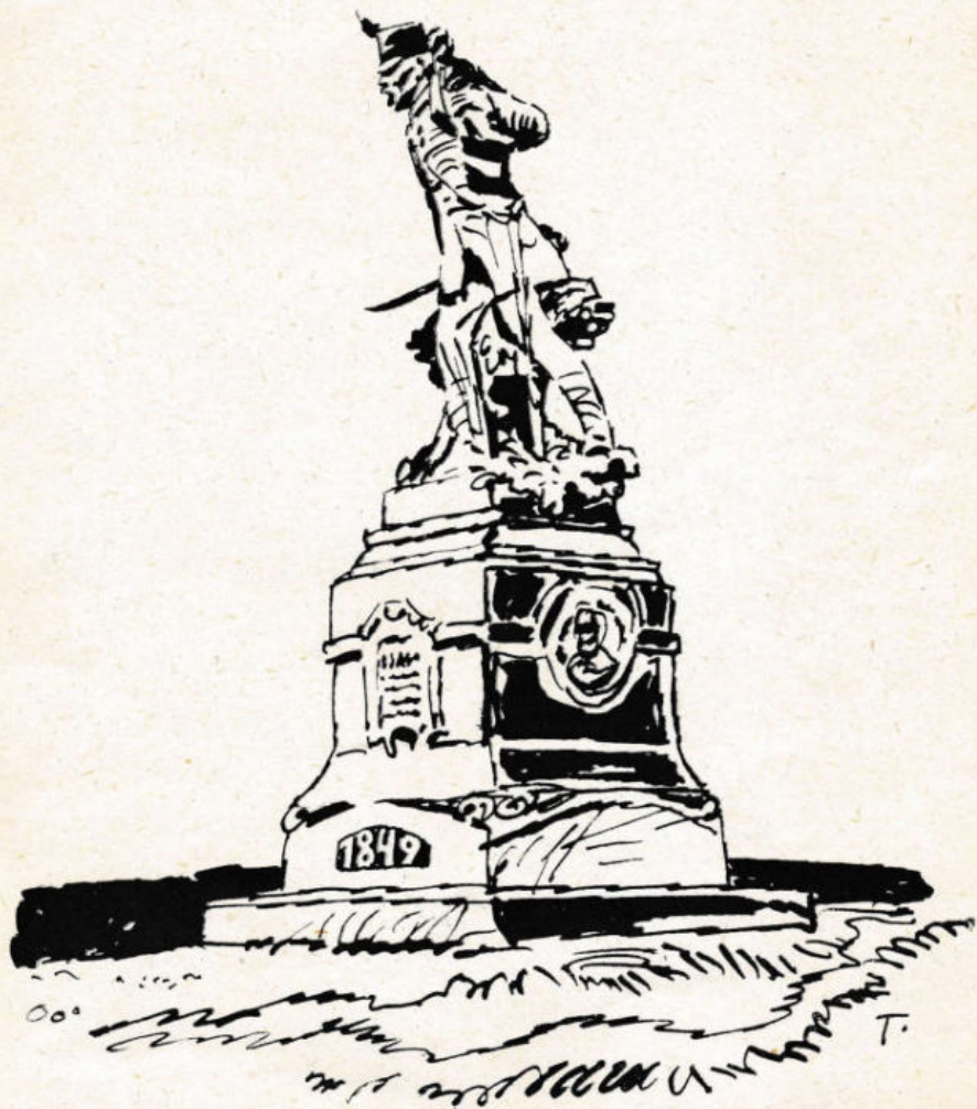
Az isaszegi csata emlékműve (Radnai Béla alkotása)