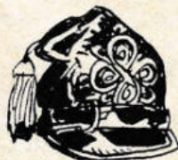
Honvéd törzstiszti sapka