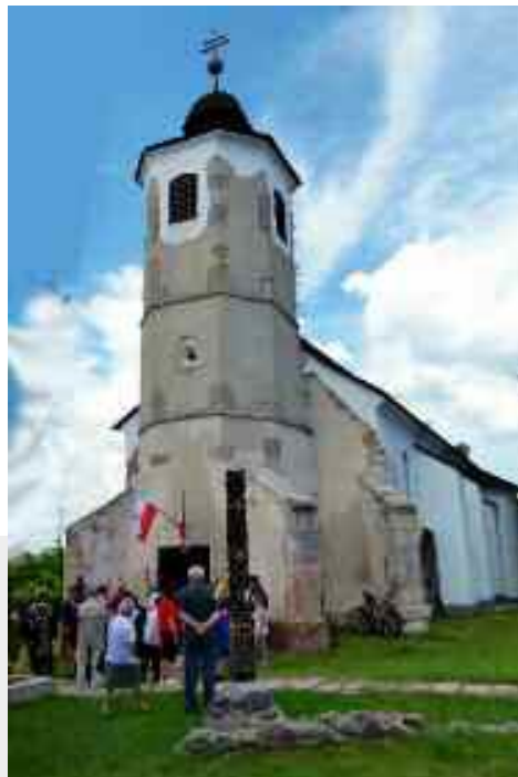
Az Árpád-kori alapokon nyugvó Öregtemplom Isaszegen