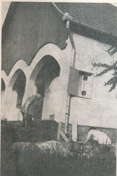
Dolgozik a villanyszerelő

tala irányított és megvalósult több rangos társadalmi építkezés kezdeményezője és befejezője volt, ezért tapasztalatai is voltak ezen a téren. Említésre méltó még, hogy fia, unokája, veje szakmunkák végzésével, a felelősége pedig a gyakori ebédhordás, üzenethordás és postázás ellátásával is nagyon szükséges társadalmi munkákat láttak el az új múzeum építkezésénél.