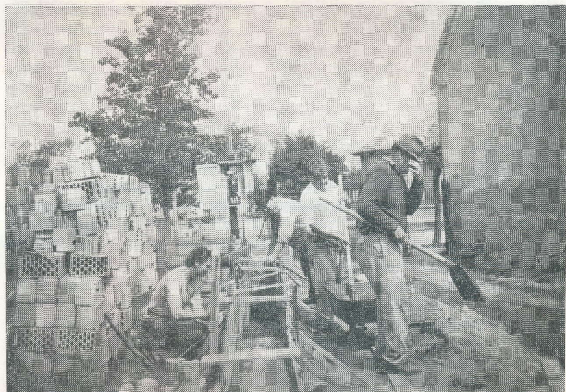
A fundamentum szintezése, zsaluzása készül — betonoznak