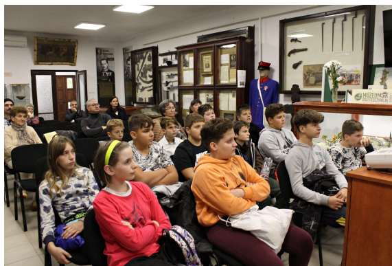
A közönség érdeklődve hallgatja az előadást