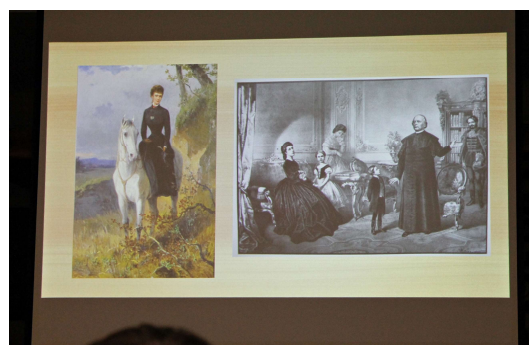
Az előadás egyik dia képe