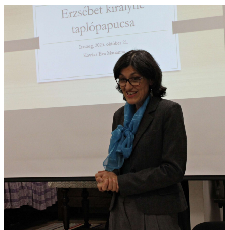
Meghívott előadónknak köszönjük, hogy felkérésünket elfogadta.