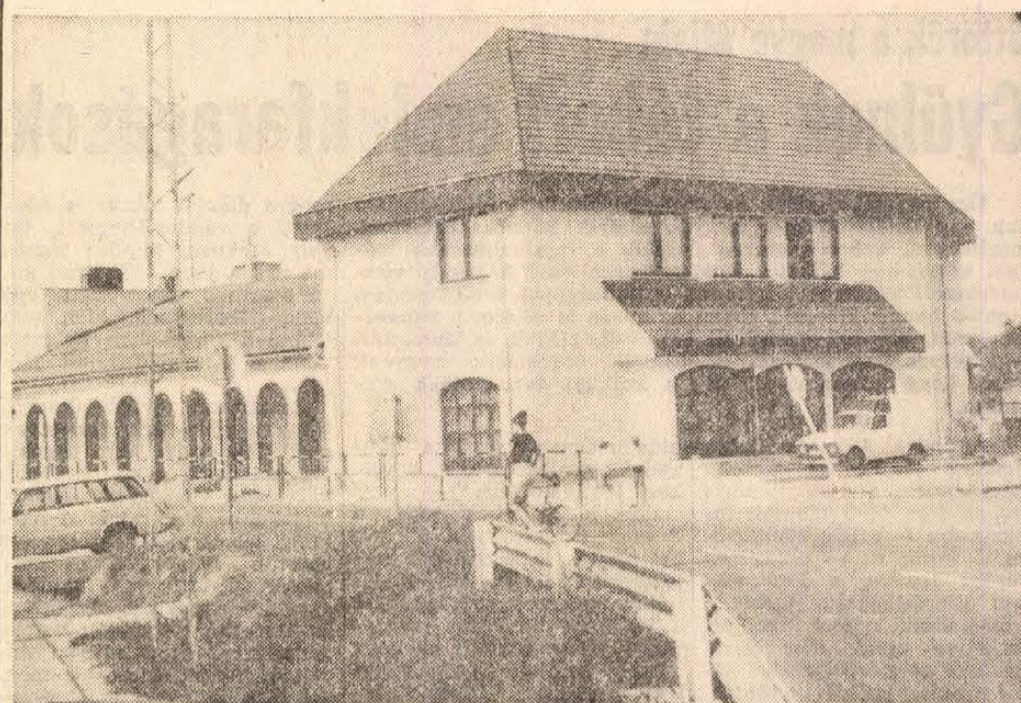
Befejeződött Isaszegen a művelődési ház bővítése. Az új épület emeletén fogadja majd olvasóit a községi könyvtár is az augusztus 18-i hivatalos átadás után