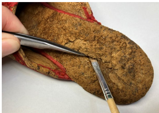
A sérült sarokrész rögzítése ragasztással

A papucs felsőrészének szélét díszítő szalagot nem bontottam le, hanem helyben konzerváltam úgy, hogy a lebegő részeket piros színű selyemszállal, öltéssel rögzítettem a felületen.