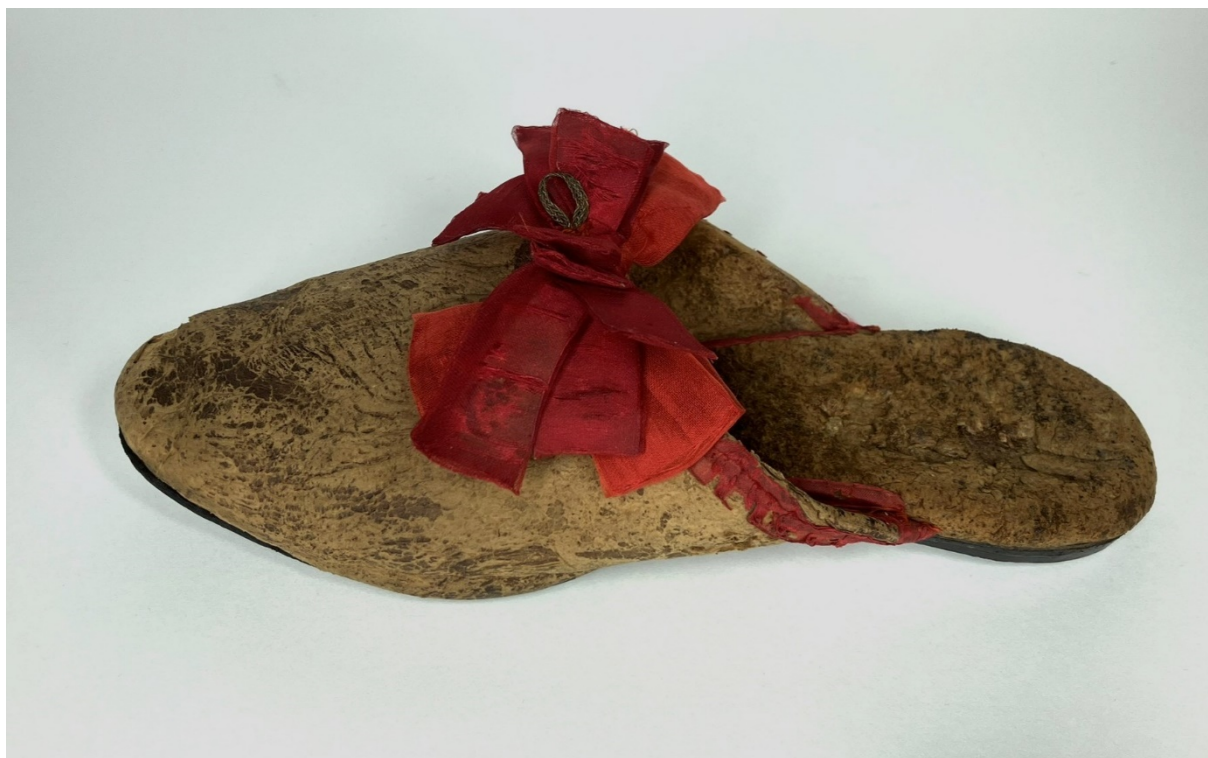
Erzsébet királyné tölgyfatapló papucsá restaurálás után

A korábbi jelölések és fotódokumentáció alapján a szalagsokrokat az eredeti formájuknak megfelelően újra összeállítottam, azzal a különbséggel, hogy egymáshoz rögzítésükhöz nem használtam ragasztót, hanem vörös pamutcérnával egymáshoz, majd a papucshoz öltöttem, így visszakerültek az eredeti helyükre.