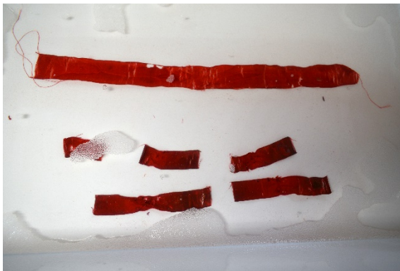
A szalagok nedves tisztítása

idejére. A talpat, a felíratos rész kivételével, alkohol és víz 1:1 arányú keverékével áttöröltem. A szalagokat vizesen tisztítottam. A vízbe 0,5 gramm/liter felületaktív anyagot (zsíralkoholszulfát) kevertem, majd a szalagokat bemelegítettem. Puha ecsetek használatával segítettem elő a szennyeződés fellazítását és távozását. A vízből kivéve a szalagon lévő, megduzzadt ragasztóréteg nagy részét csipesszel mechanikusan sikerült eltávolítani. Ahol erősen kötött a gyenge selyemszálakhoz, ott rajta hagytam, hogy elkerüljem a további sérüléseket. A szalagokat síkban, rozsdamentes rovartűkkel kitéúzve hagytam megszáradni.