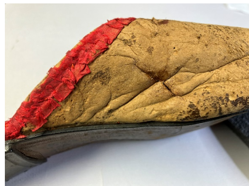
Az oldalsó hasadás ragasztás után