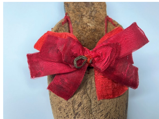
A szalagcsokor konzervált elemei összeállítás előtt és után