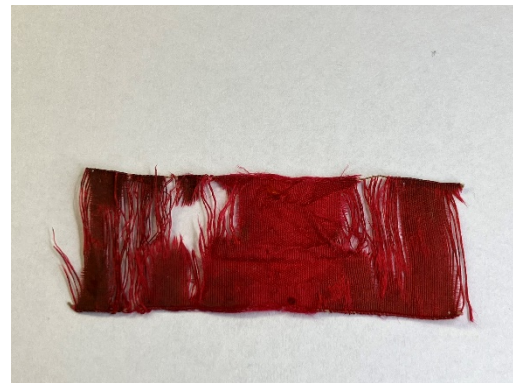
Síkban szárított egyik szalag

Konzerválás: A papucs belső sarokrészén az alapanyag meggyengült, töredezett állapota miatt szükséges volt a rögzítése. Ehhez visszaoldható, sűrűre főzött rizskeményítőt alkalmaztam, melyet ecsettel juttattam az érintett felületekre. A papucs jobb oldalán lévő nagyobb hasadást is ezzel rögzítettem, hogy megelőzzem a további sérülését. A tölgyfataplón keletkezett hiányok nem kerültek kiegészítésre.