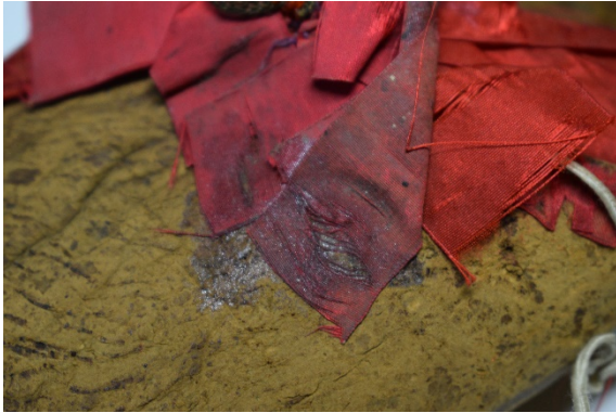
A leragadt szalagdízsz

darab szalagból hurkolással alakították ki. A felső sötétvörös szalagsokrot 5 darab különböző hosszúságú szalagból meghajtva és egymáshoz öltve hozták létre. A két szalagsokrot ragasztással rögzítették egymáshoz, majd varrással rögzítették a papucson.