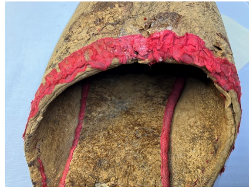
A szegőszalag varrókonzerválás közben és után

A szalagcsokrok konzerválását színükhöz hasonlóra megszínezett hernyóselyem kreplin közé varrva végeztem el, mert ezt tartottam hosszútávon a legbiztonságosabb megoldásnak, hiszen a kreplin körülveszi a szalagot, így mindkét felületét védi. Ez a módszer a lehető legkíméletesebb a sérült textilek esetében, mert az eredeti szövetet még a varrás által sem sértjük meg, mivel itt csak a kreplinbe öltünk. A varráshoz is hasonló árnyalatúra színezett hernyóselyem szálát és görbetűt használtam.