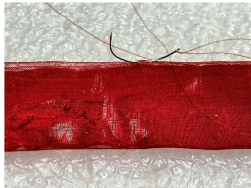
Az egyik sérült szalag bevonása kreplinnel