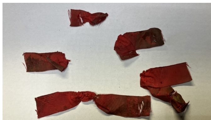
A szétbontott felső szalagsokor részei

Tisztítás: A papucs teljes felületét műtárgyporszívóval óvatosan, gyenge fokozaton áptorszívóztam kívül, belül. A gyenge, töredezett sarokrészt tüllhálóval védtem le a művelet