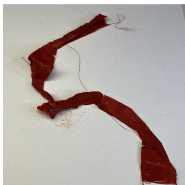
A szétbontott alsó szalag