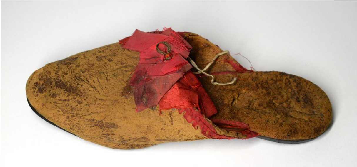
A papucs állapota restaurálás előtt

és deformálódott, nagy felületeken a papucs felsőrészéhez ragadt. A vékonyabb, gyengébb láncfonalak elszakadása miatt a szalagon főleg vetülékirányú hasadások keletkeztek. A papucson lévő fém alkatrészek, a szögek és a szalagcsokor közepén lévő fémfonalas díszítmény korrodálódott.