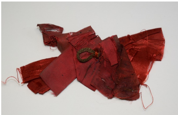
A lebontott díszítmény