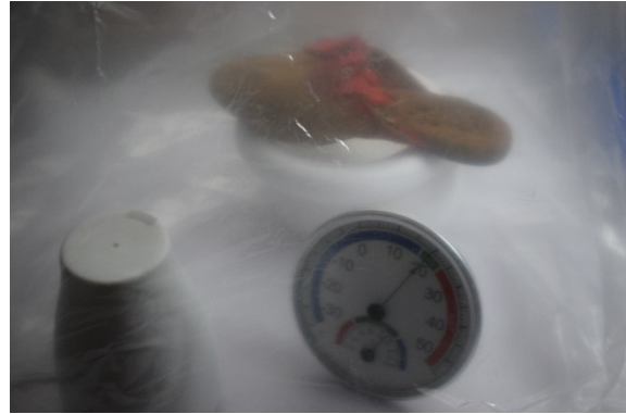
A papucs párásítása